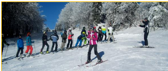
Text a fot: žáci 7. E, F

Žáci, kteří se kvůli nemoci nemohli lyžařského kurzu zúčastnit, po zhlédnutí fotografií a z vyprávění spolužáků hodnotí pobyt na horách také velmi pozitivně a při vyprávění spolužáků se mnoha věcem nesčetněkrát zasmáli.