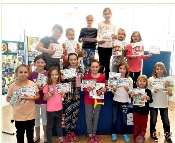
Za ŠD Slovákova A. Koutná

K velkému úspěchu gratulujeme a zároveň děkujeme všem našim dětem, které s chutí a radostí tvořily, svoje práce dokončily, a podpořily tak tento úžasný projekt pro děti.