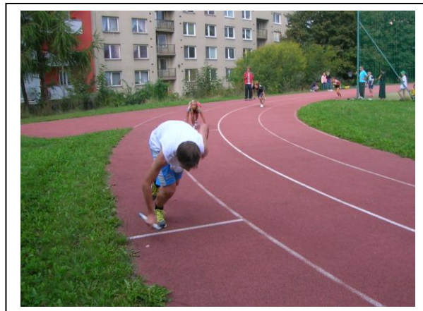
start štafet II. stupně