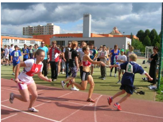
vítězná štafeta II. stupně – štafeta ZŠ Boskovice, Slovákova