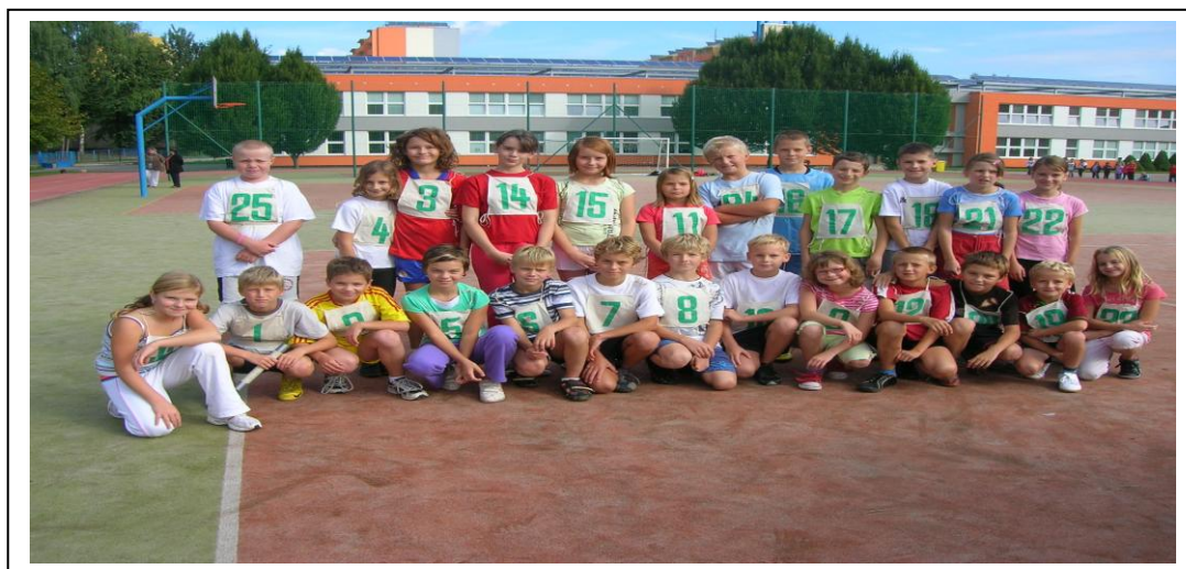
vítězná štafeta I. stupeň