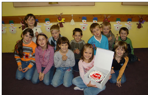
Vítězná 2. E