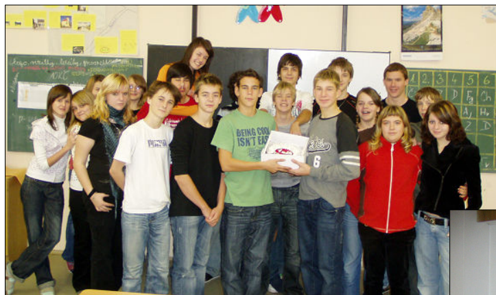
Vítězná 9. F