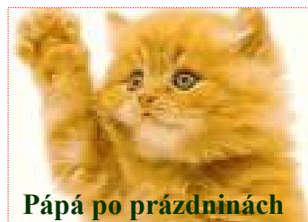
Pápá po prázdninách

Adresa redakce: ZŠ Boskovice, okres Blansko Slovákova 8 680 01 Boskovice