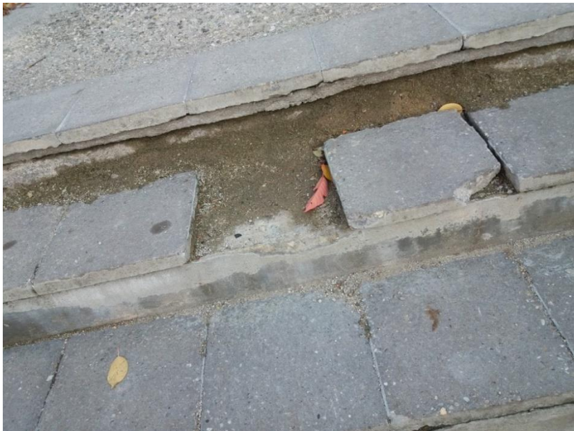
Fotografie č. 3