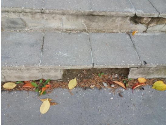
Fotografie č. 1