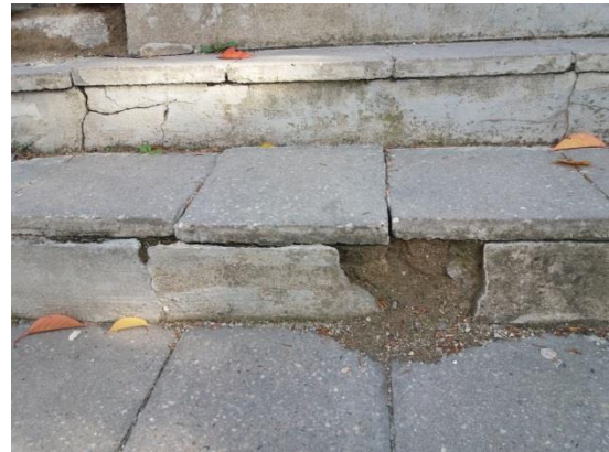
Fotografie č. 2