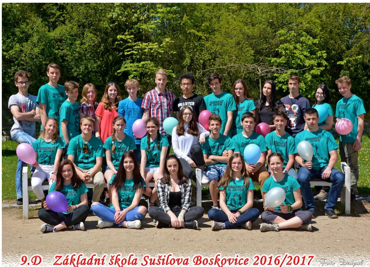
9.D Základní škola Sušilova Boskovice 2016/2017