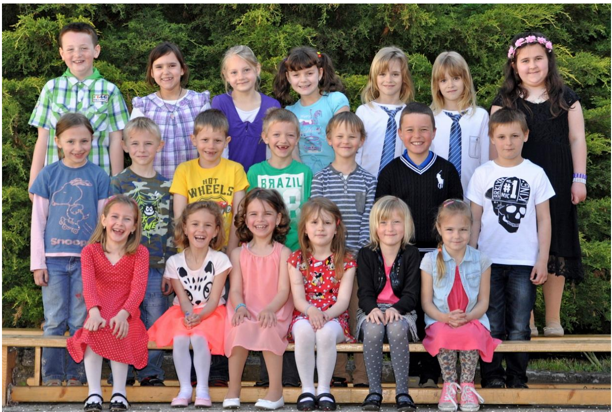
1.E Základní škola Sušilova Boskovice 2016/2017