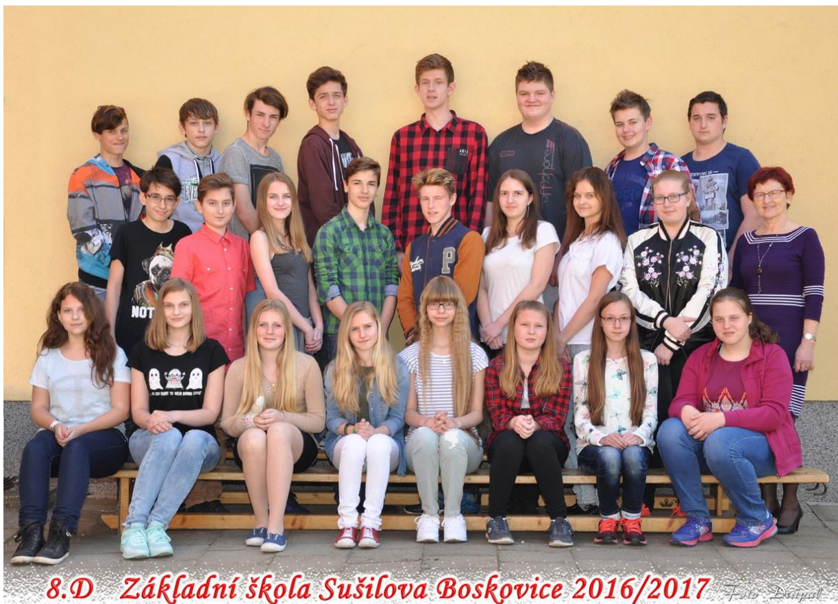
8.D Základní škola Sušilova Boskovice 2016/2017