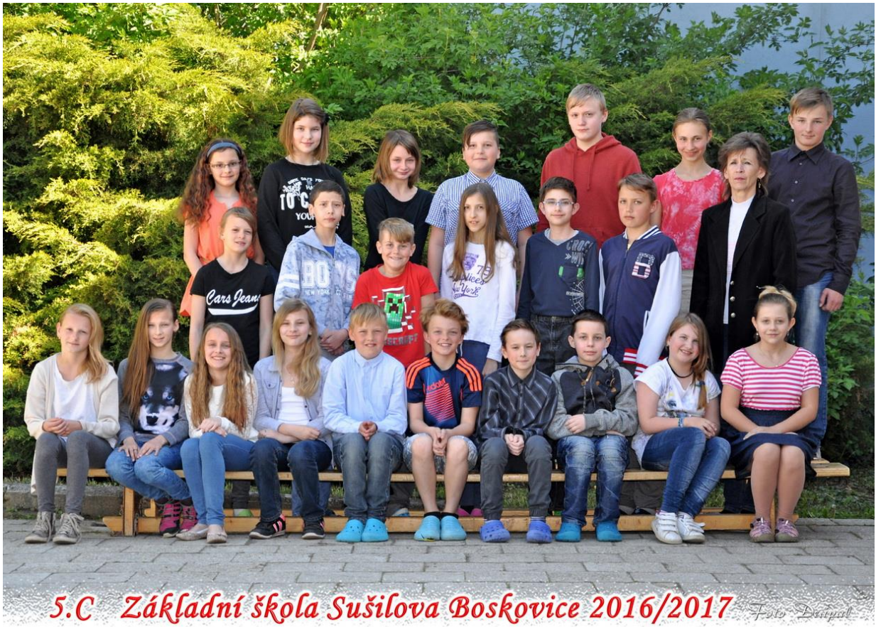
5.C Základní škola Sušilova Boskovice 2016/2017