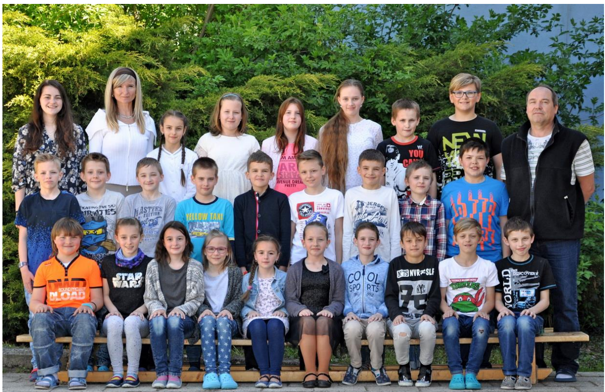
4.D Základní škola Sušilova Boskovice 2016/2017