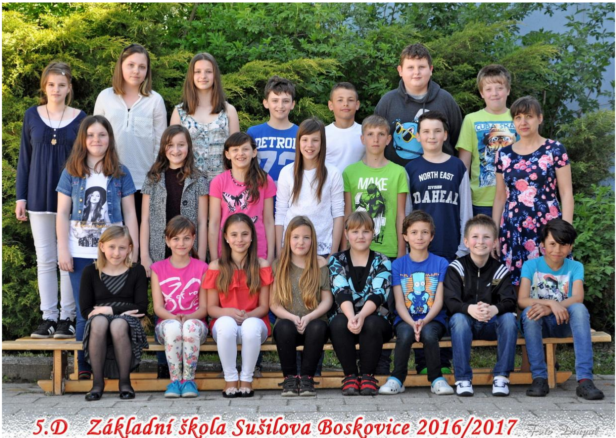
5.D Základní škola Sušilova Boskovice 2016/2017