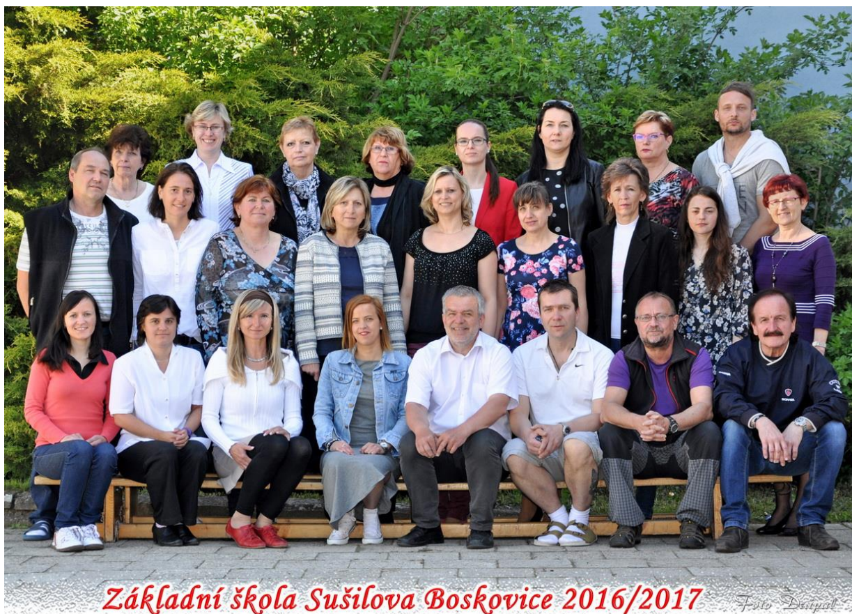
Základní škola Sušilova Boskovice 2016/2017