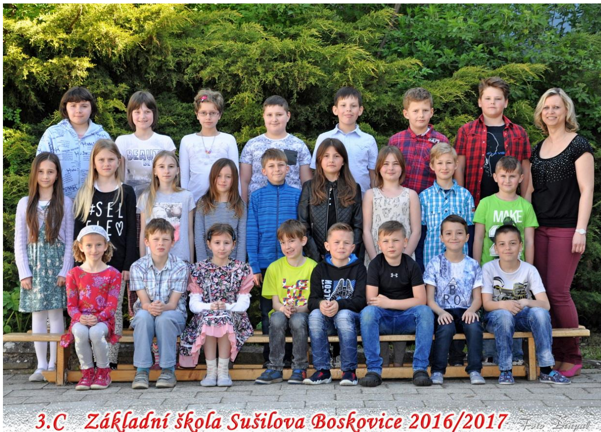
3.C Základní škola Sušilova Boskovice 2016/2017