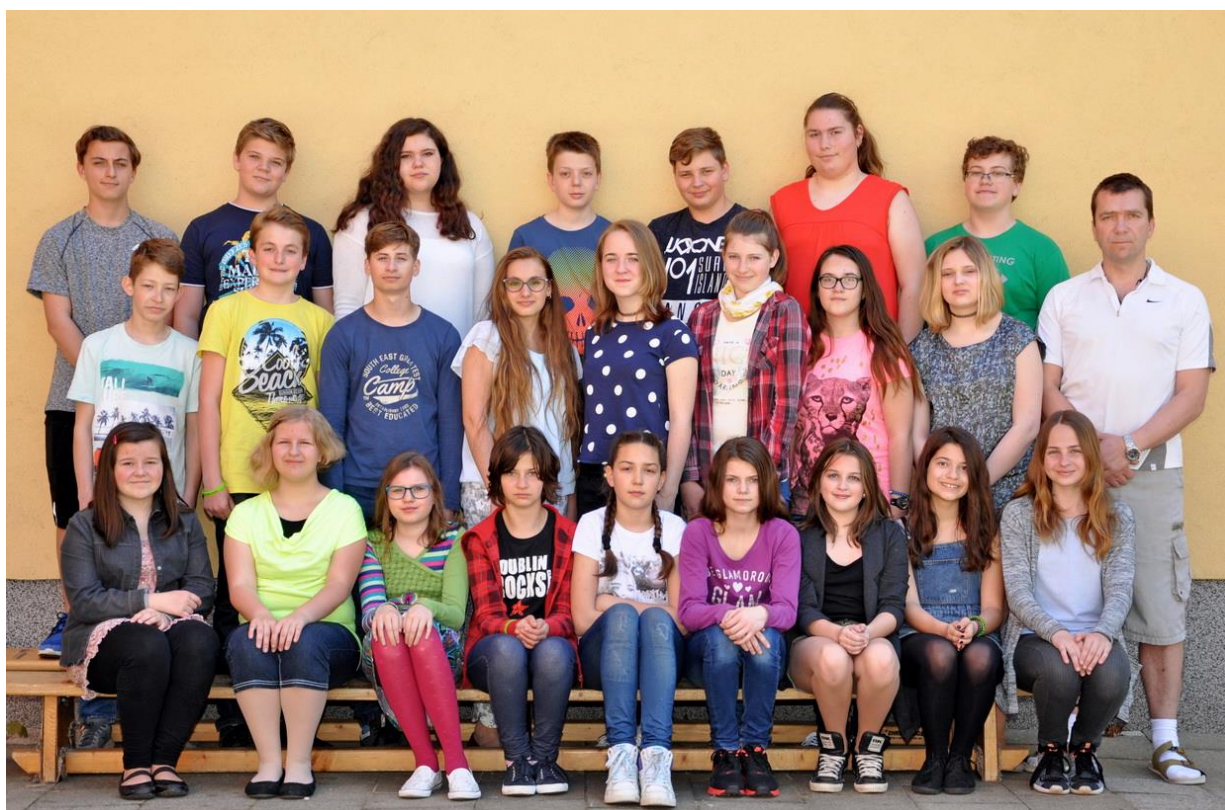
7.C Základní škola Sušilova Boskovice 2016/2017