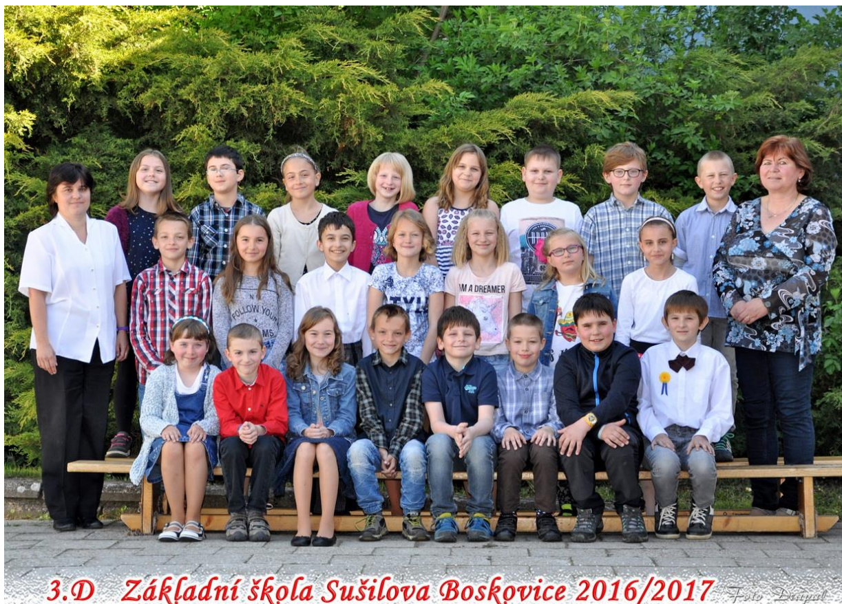
3.D Základní škola Sušilova Boskovice 2016/2017