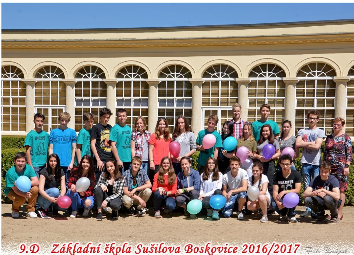
9.D Základní škola Sušilova Boskovice 2016/2017