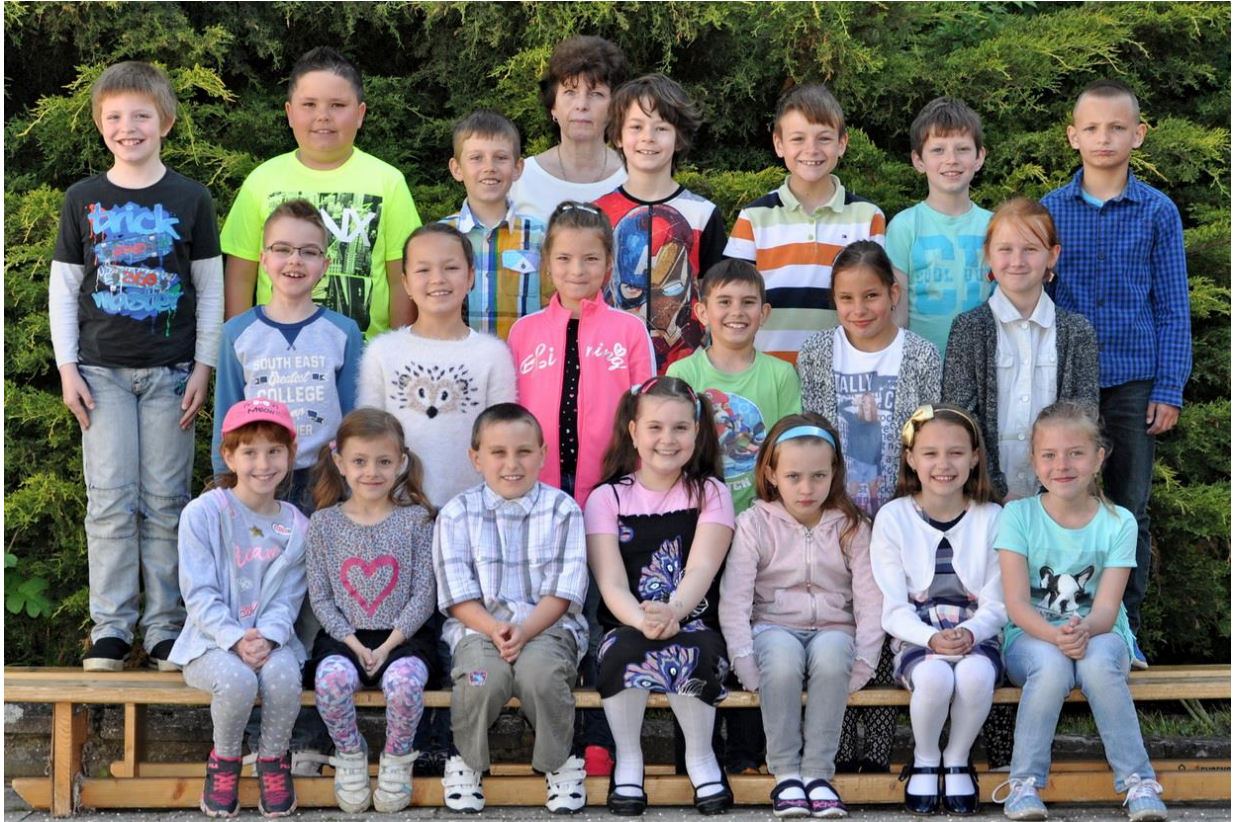
2.C Základní škola Sušilova Boskovice 2016/2017