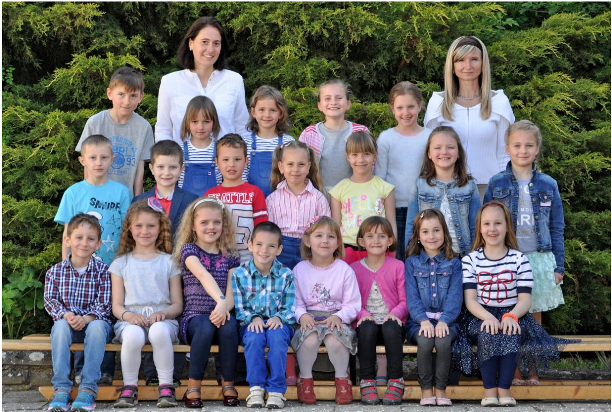
1.D Základní škola Sušilova Boskovice 2016/2017