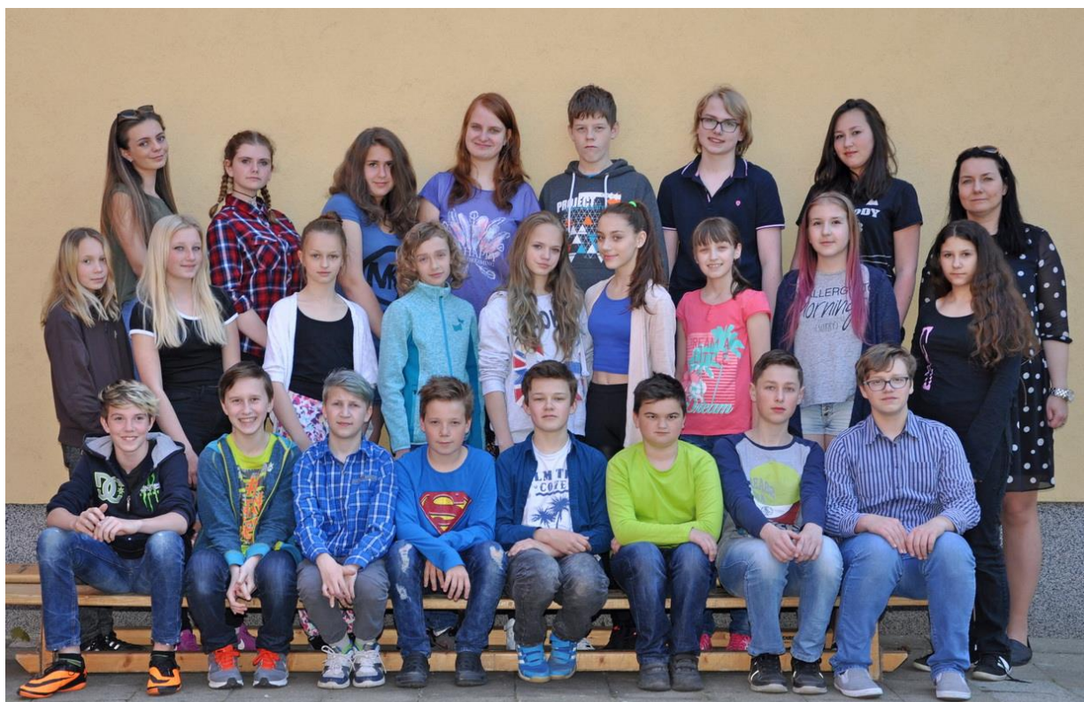
7.D Základní škola Sušilova Boskovice 2016/2017