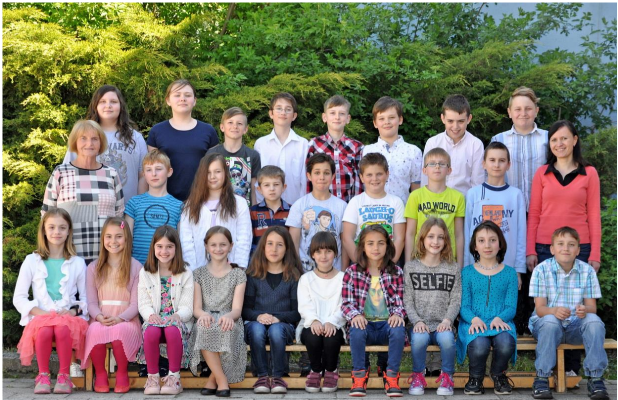
4.C Základní škola Sušilova Boskovice 2016/2017