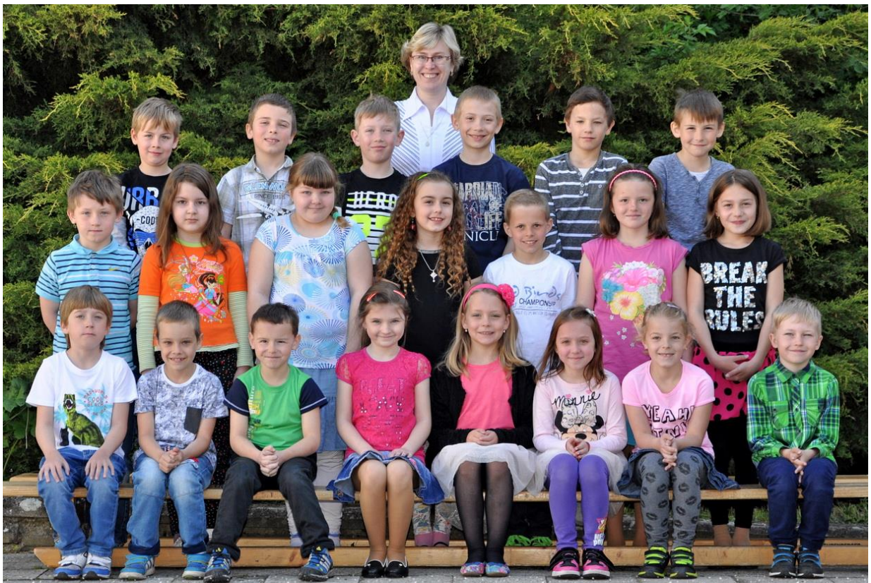
2.D Základní škola Sušilova Boskovice 2016/2017