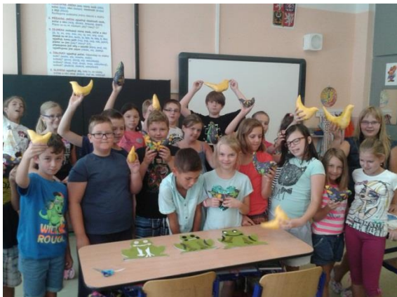
kolektivní práce žáků 1. a 2. stupně