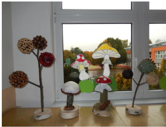
podzimní výzdoba chodeb: práce s přírodním materiálem