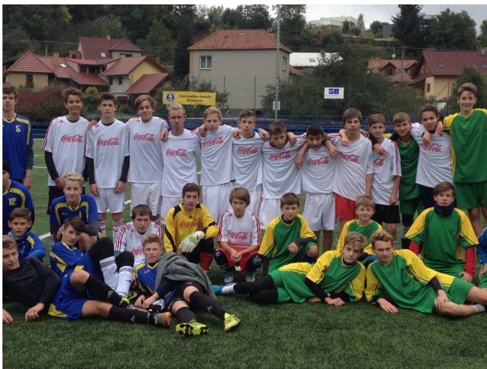
společné foto týmů našich pracovišť