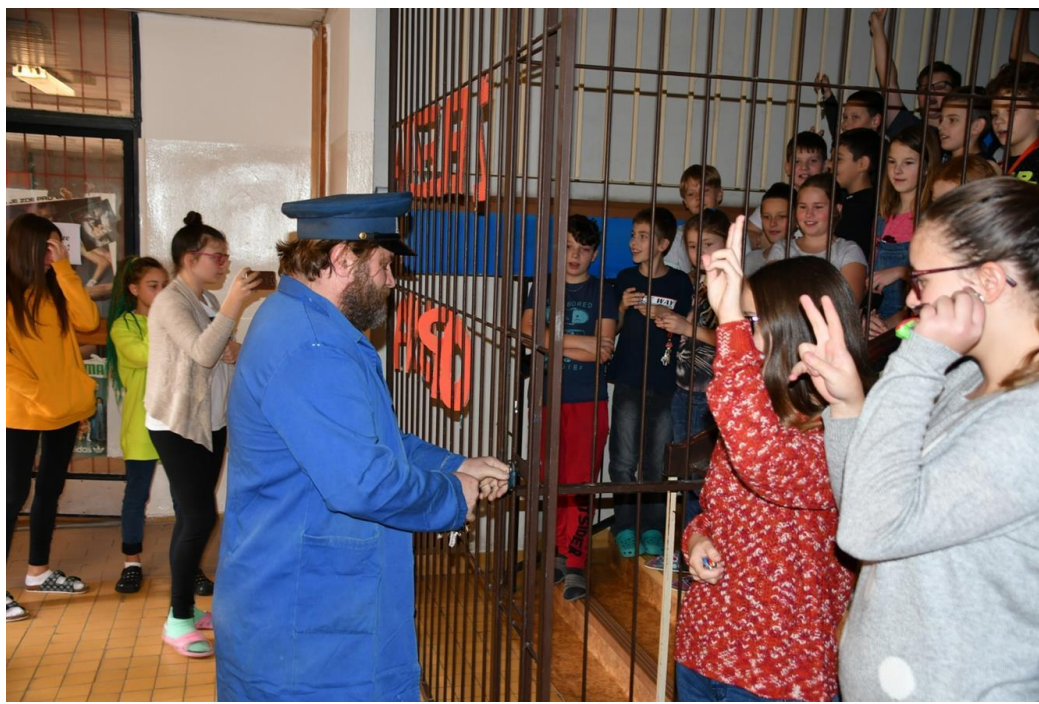
Vyvrcholení projektu 30 let svobody - pád železné opony