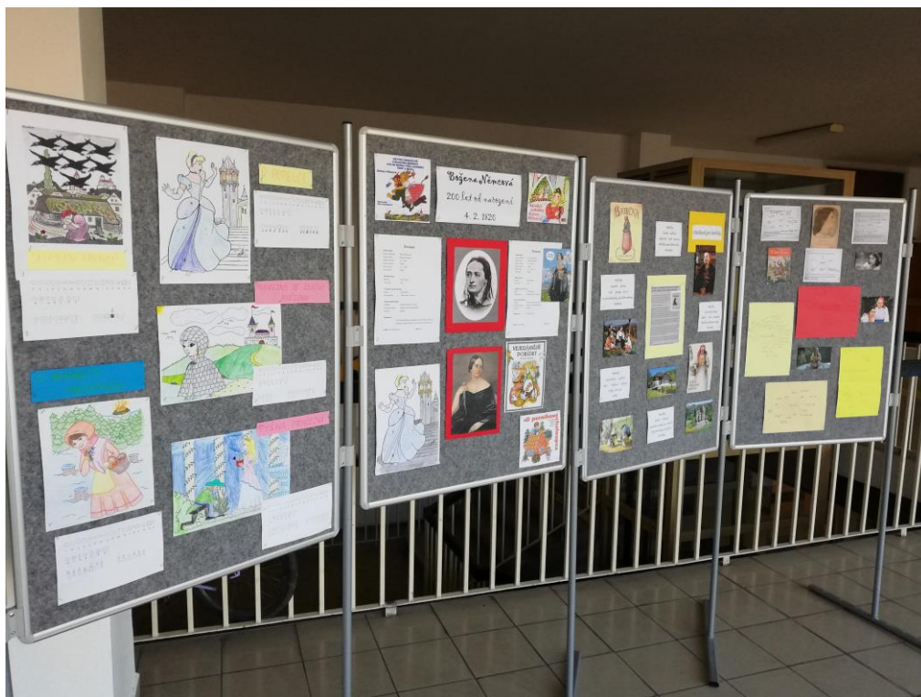
Slovákova - Výročí 200 let od úmrtí B. Němcové

recitace 1. - 5. ročník, Listování - kino Panorama (1. a 6. ročník), Týden zdravých svačin - soutěž, příprava LVK pro žáky 7. ročníku, DVPP - Robotika (ZŠ Slovákova), DVPP - Solární, větrná energetika (ZŠ Slovákova), ŠD - Valentýnská pošta - tvorba valentýnek pro kamarády, Valentýnské dílničky, Masopustní maškarní odpoledne ve spolupráci se studentkami SPgŠ, příprava Anglické burzy, Závody psích spřežení