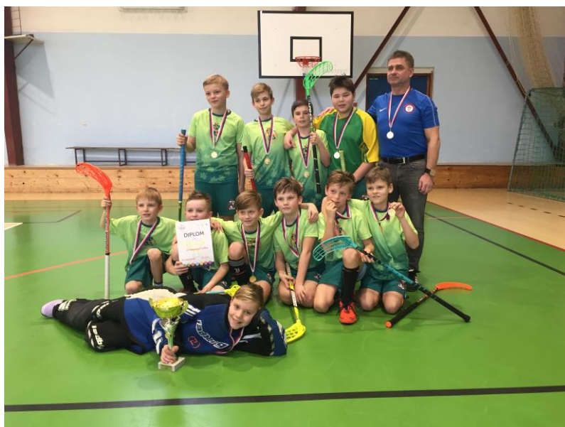
Zelená - okresní soutěže ve florbalu a 1. místa žáků 1. stupně a starších žáků