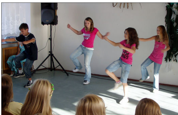
▲ Taneční skupina složená z žáků 6. F