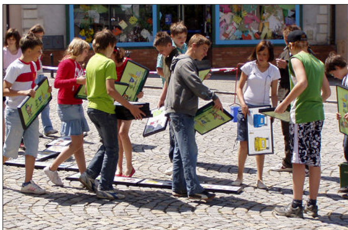
◀ ▲ soutěže a hry s ekologickou tematikou