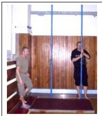
Tatínci se chystají ke šplhu