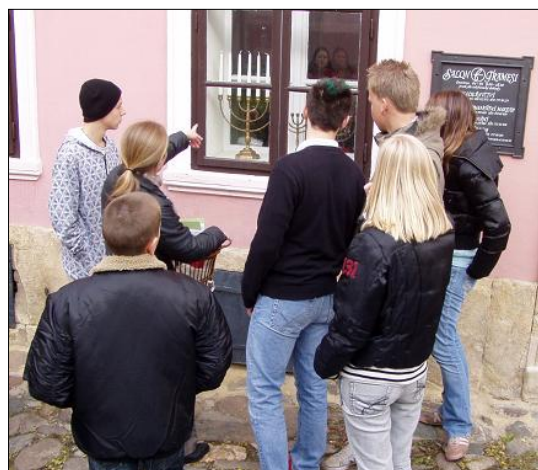
▲ Prohlídka sedmiramenného svícnu.