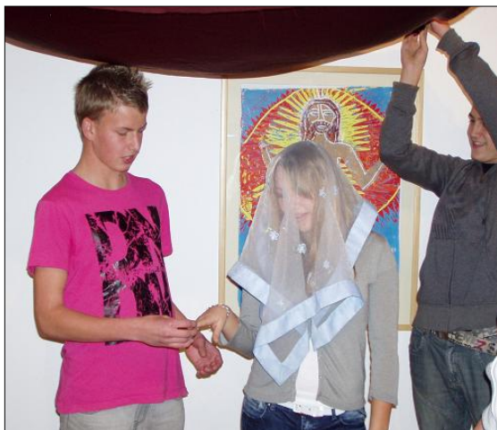
▲ Navléknutí prstýnku pod baldachýnem.