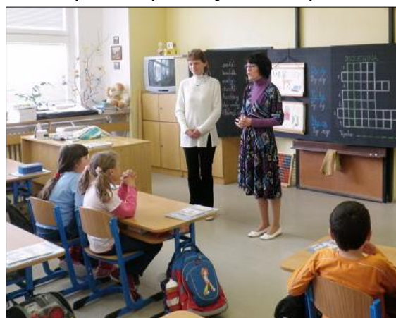
▲ Návštěva chorvatské pedagožky ve třídě na 1. stupni. ◀ Prohlídka kroniky školy a školních časopisů Slováček.