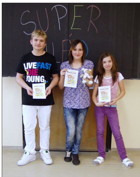
Vítězové 1. kategorie