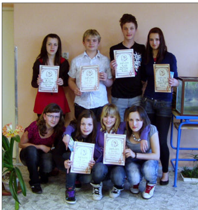
▲ Žáci, kteří postoupili do městského kola RH Faktor