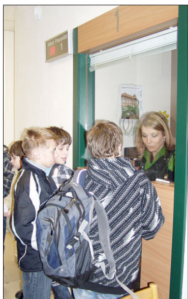
▲ Tady jsou žáci na skutečném úřadu...