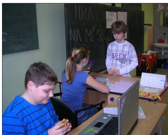
▲ ...a tady si již ve třídě na úředníky hrají.