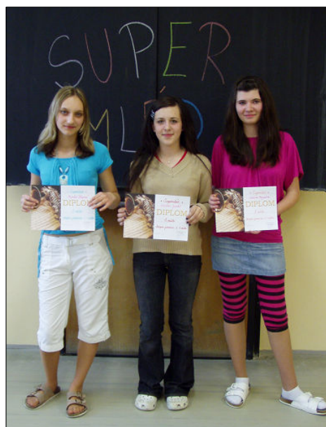
Vítězové 2. kategorie