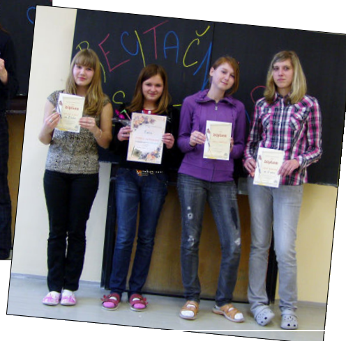
▶ Vítězové ve starší kategorii