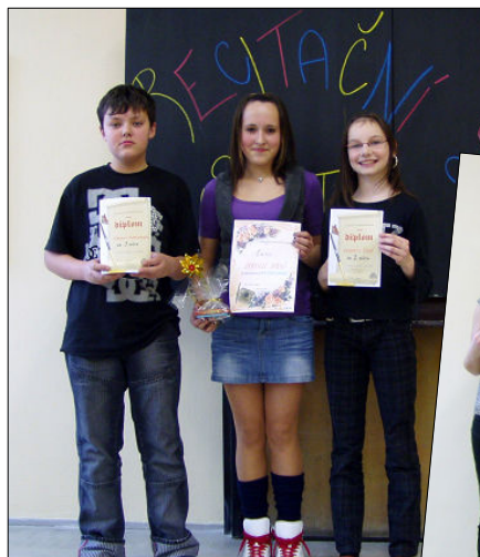
◀ Vítězové v mladší kategorii