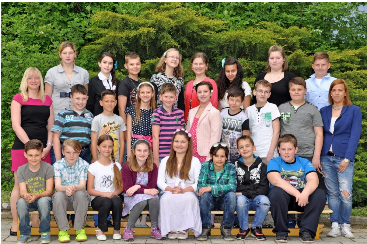
5.C Základní škola Sušilova Boskovice 2015/2016