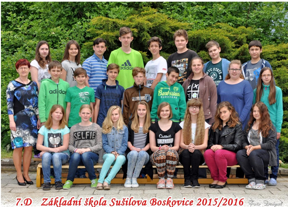
7.D Základní škola Sušilova Boskovice 2015/2016