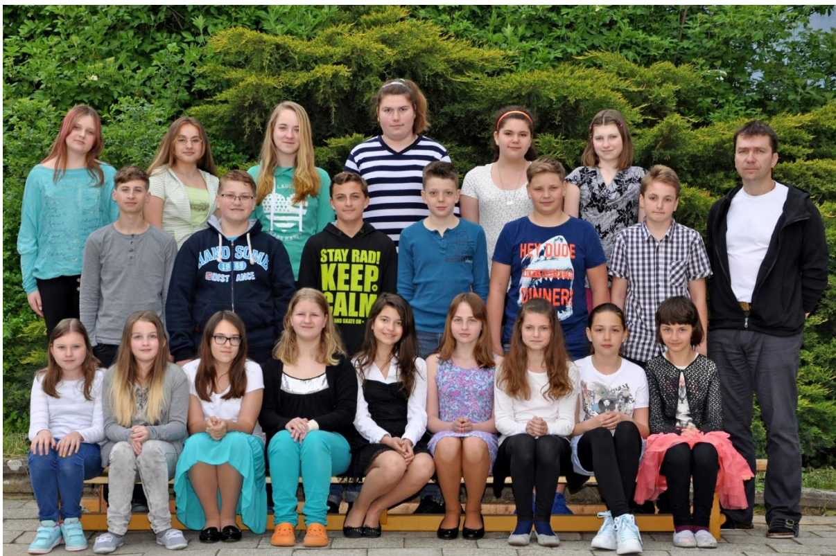
6.C Základní škola Sušilova Boskovice 2015/2016