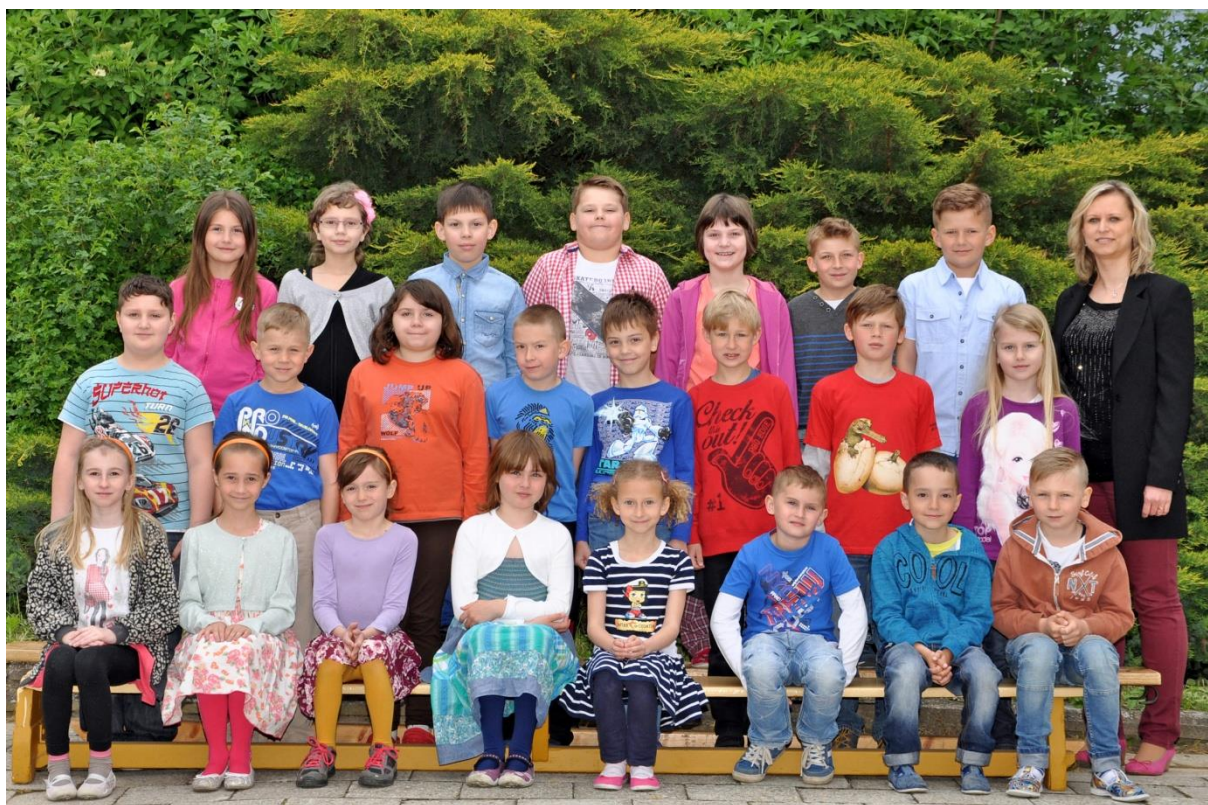
2.C Základní škola Sušilova Boskovice 2015/2016