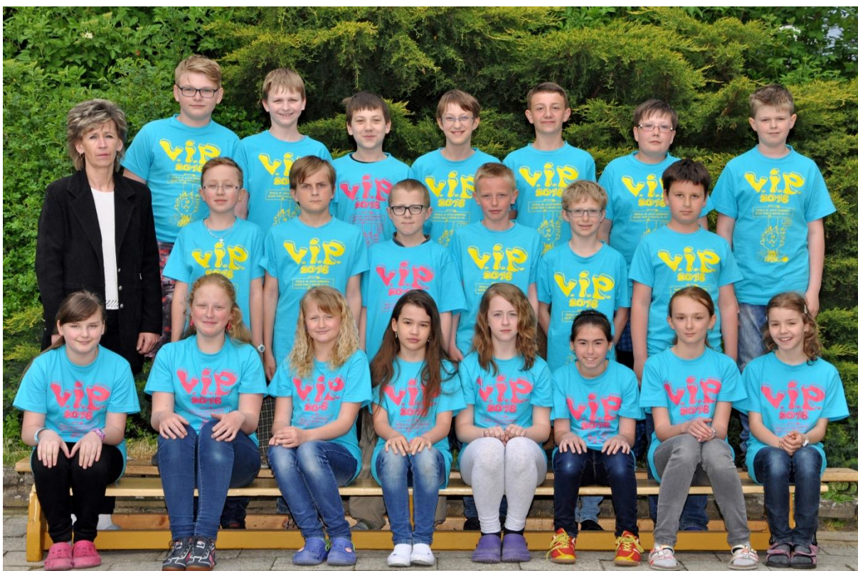
5.D Základní škola Sušilova Boskovice 2015/2016