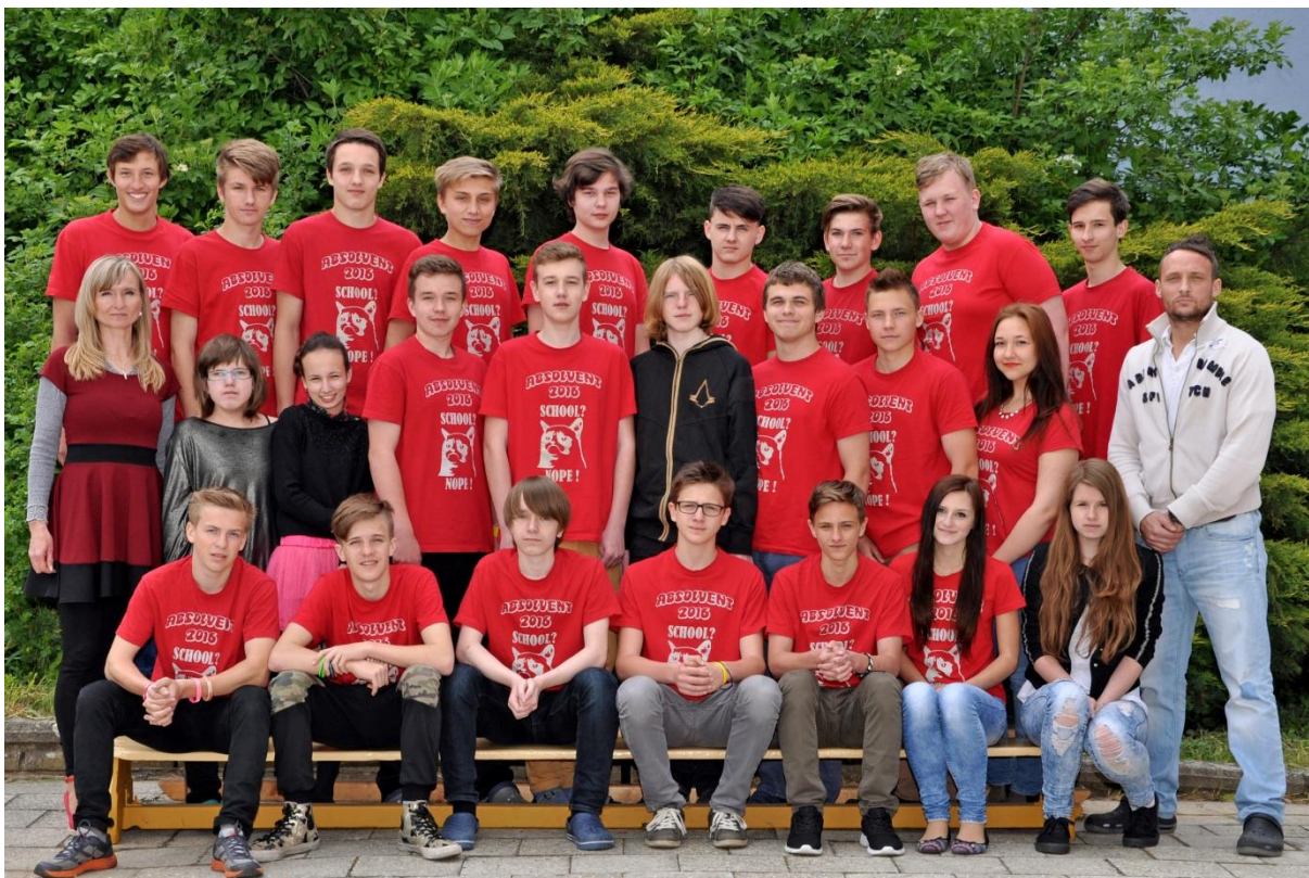
9.C Základní škola Sušilova Boskovice 2015/2016