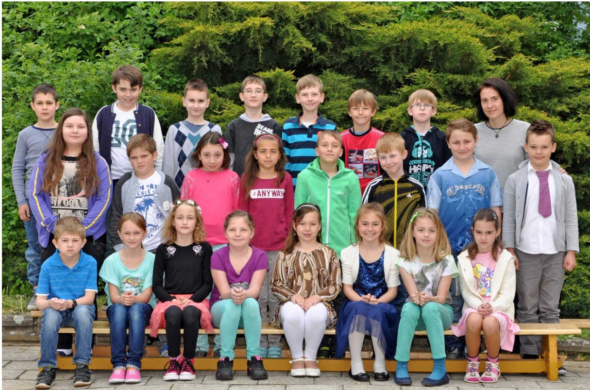
3.C Základní škola Sušilova Boskovice 2015/2016