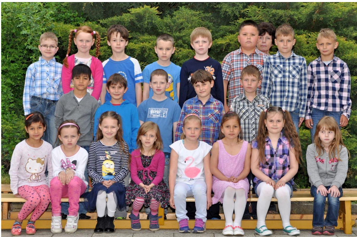
1.C Základní škola Sušilova Boskovice 2015/2016