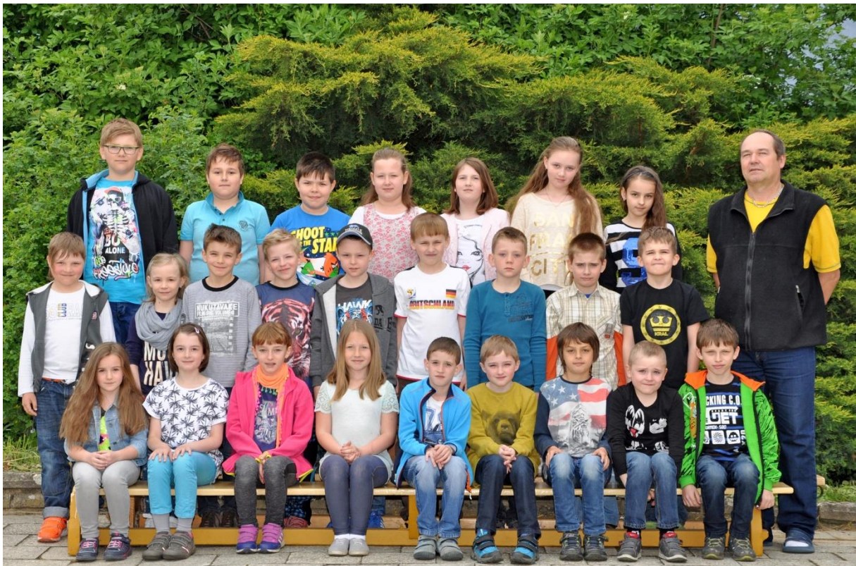
3.D Základní škola Sušilova Boskovice 2015/2016