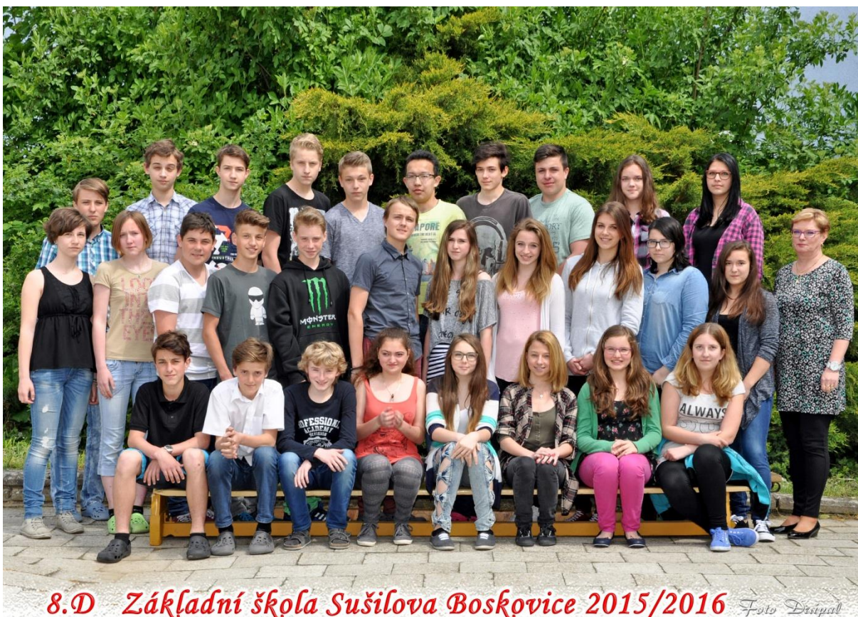
8.D Základní škola Sušilova Boskovice 2015/2016