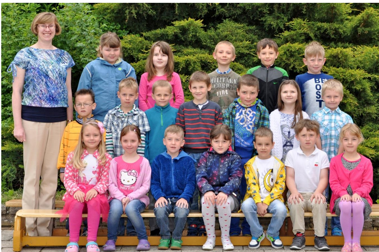
1.D Základní škola Sušilova Boskovice 2015/2016