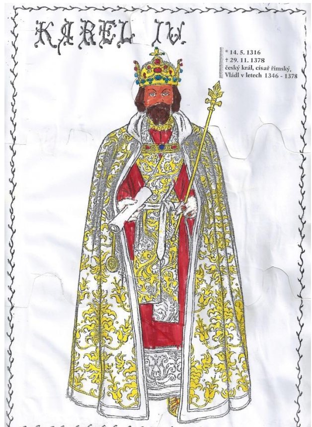
Portrét Karla IV. je slepený ze šesti dílků puzzle.