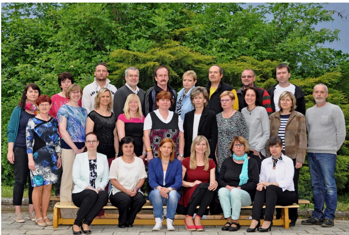
Základní škola Sušilova Boskovice 2015/2016