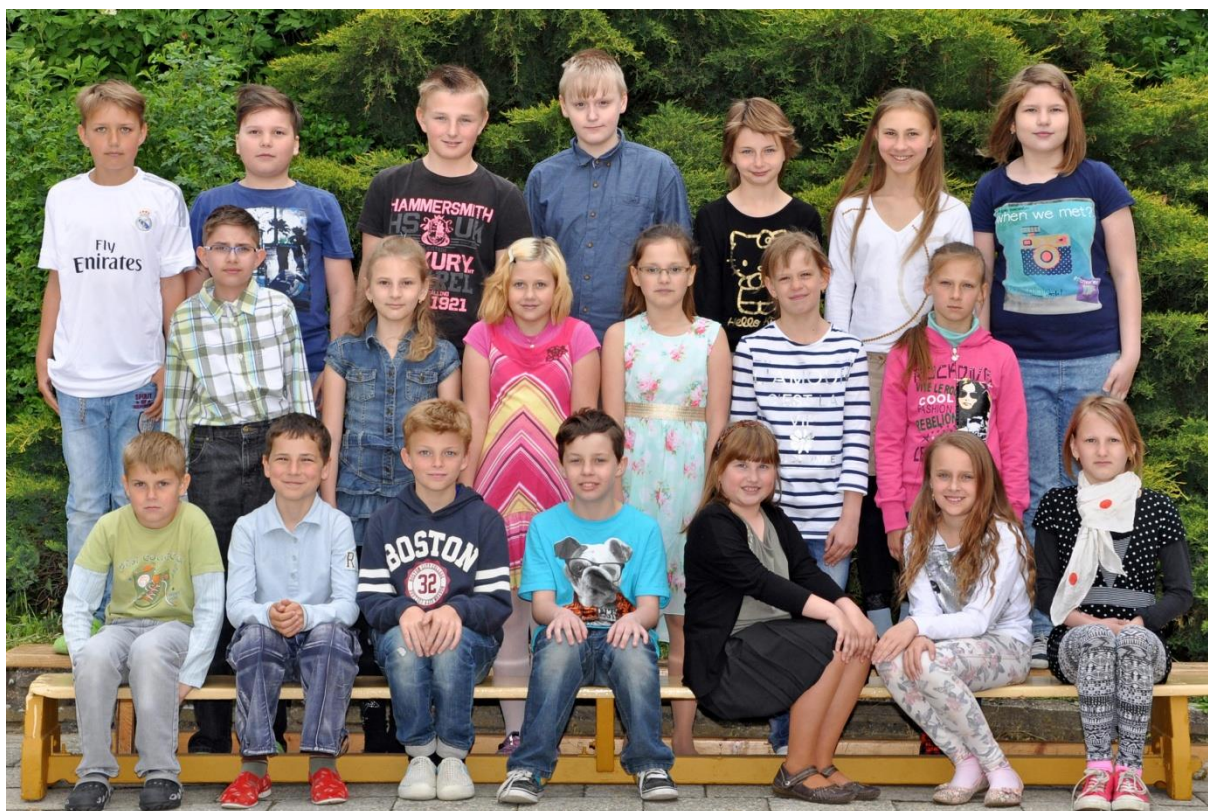
4.C Základní škola Sušilova Boskovice 2015/2016