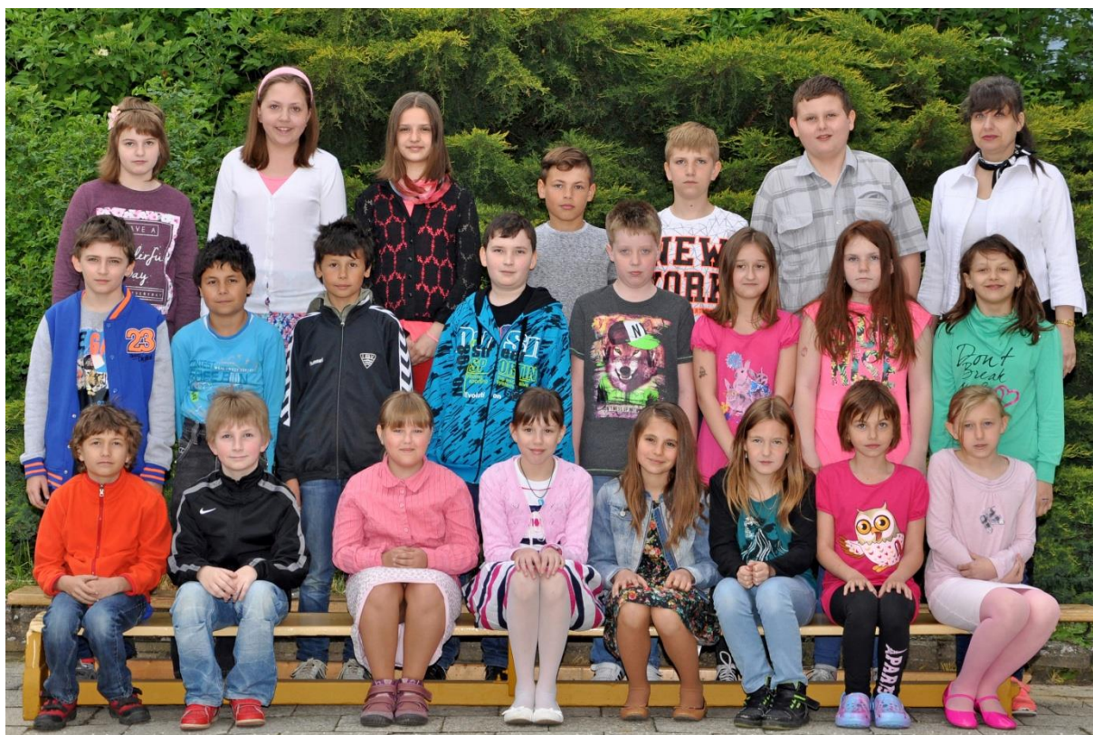
4.D Základní škola Sušilova Boskovice 2015/2016