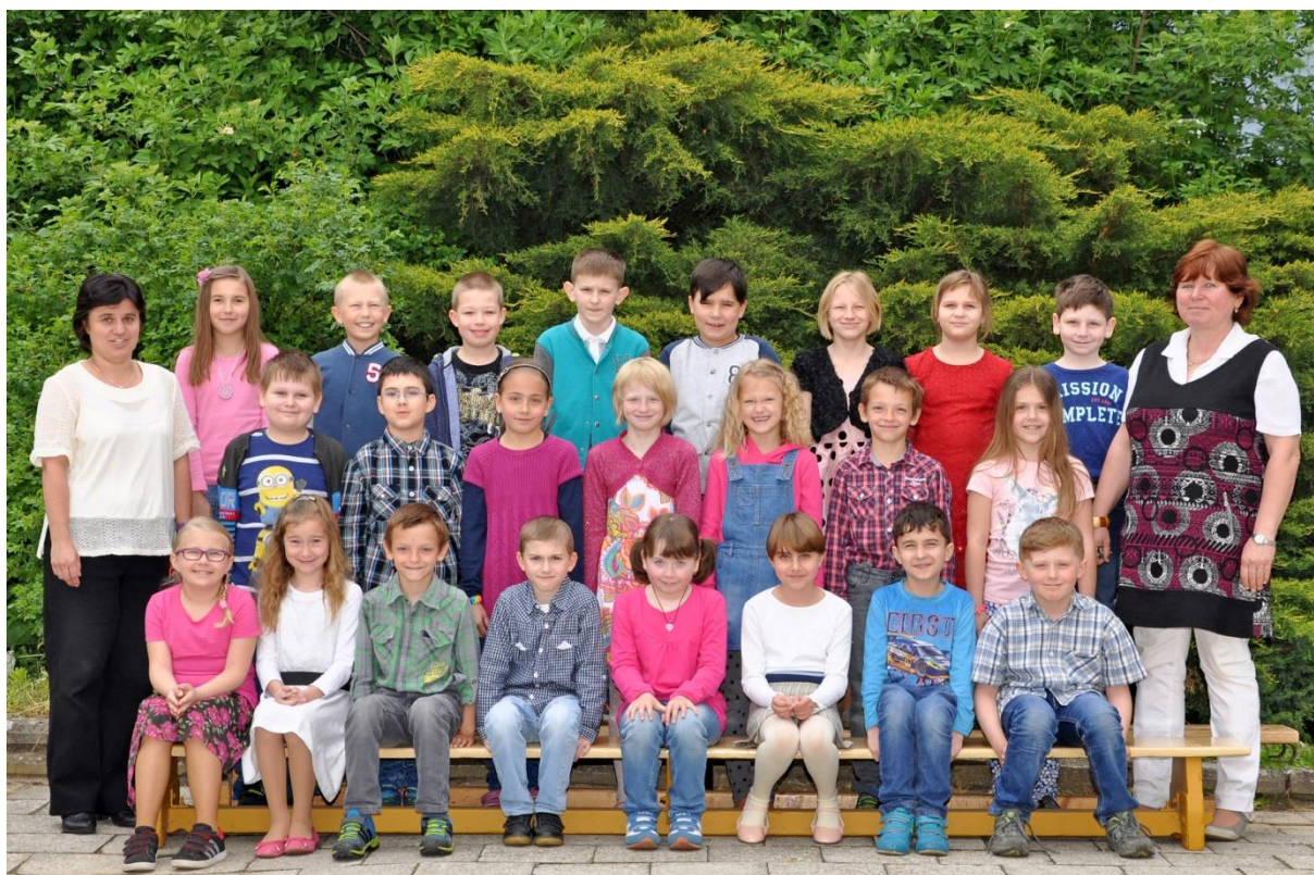
2.D Základní škola Sušilova Boskovice 2015/2016