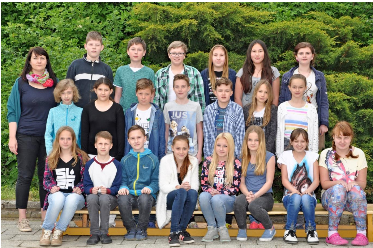
6.D Základní škola Sušilova Boskovice 2015/2016