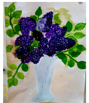
Obrázky šeriků namalovaly Barbora Krušinová a Štěpánka Kovářová z 5. E