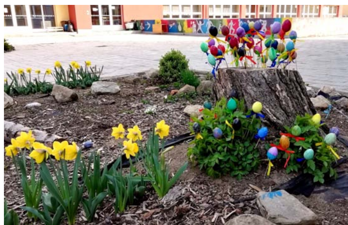
Děti ze 4. C ve vyučovací hodině výtvarné výchovy nabarvily velikonoční vajíčka a vyzdobily školní nádvoří.